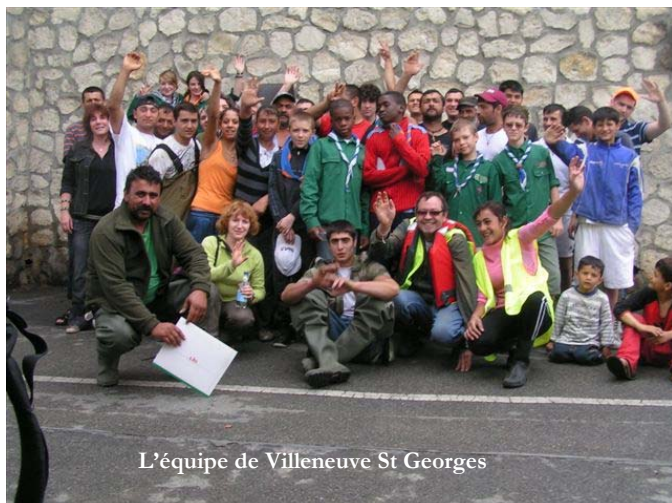
L'équipe de Villeneuve St Georges

L'aventure continue dans un esprit constructif comme au tout début, en 1992. Mais le secteur reste sale et méprisé par de nombreux citoyens. Peut-être pas simplement des habitants de la ville, mais certainement de la région proche. On ne peut cependant que saluer l'accueil et les efforts considérables de la Maire et de ses élus. Petite nouveauté : à la demande de ses derniers, les opérations de OSE s'orienteront vers la prévention comme en mai dernier, via la distribution de poubelles aux Roms installés le long des berges. Puis, plus directement et grâce en partie au Conseil Général et à son aide technique et financière, une ébauche de nos actions de nettoyages a pu avoir lieu sur l'Yerres, gravement touchée par la négligence de certains depuis des années déjà. Cette année, il y a eu en tout 2 grands dimanches d'action avec plus de 200 participants pour l'ensemble de la campagne de protection. De plus, lors de ces journées, des équipes se sont éparpillées sur d'autres secteurs comme Vigneux sur Seine (91), l'Yerres, Villeneuve Triage, et Ivry sur Seine. Des records absolus dans tous les sens du terme. Un grand bravo et tout nos remerciements à la Ville de Villeneuve St Georges , au Conseil Général , au SIAAP , au PAP , à la DIREN et aux VNF .