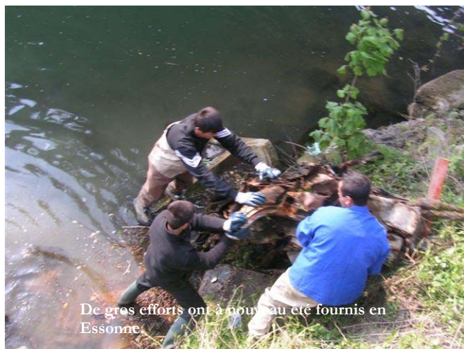
De gros efforts ont à nouveau été fournis en Essonne.

manqué à l'appel. Adeline, qui travaille à AXA, m'a demandé pour compenser de solliciter plus fortement les Roms, qui eux ont répondu présents en nombre. Les participants ont fourni un travail digne de ce nom. L'agglomération « Les portes de l'Essonne » ne fera que ramasser tous les déchets déjà triés à la source par l'ensemble des bénévoles.