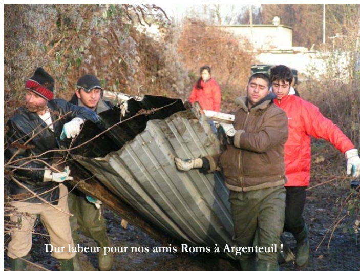
Dur labeur pour nos amis Roms à Argenteuil !

Halage , avec leurs programmes de réinsertion, et des institutions comme la CAAB et le département du 95 qui épaulent comme il le faut l'ensemble des opérations menées par les uns et les autres.