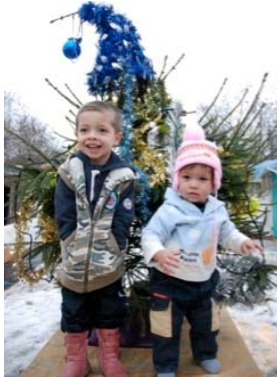
Adieu aussi mes petits chéris....