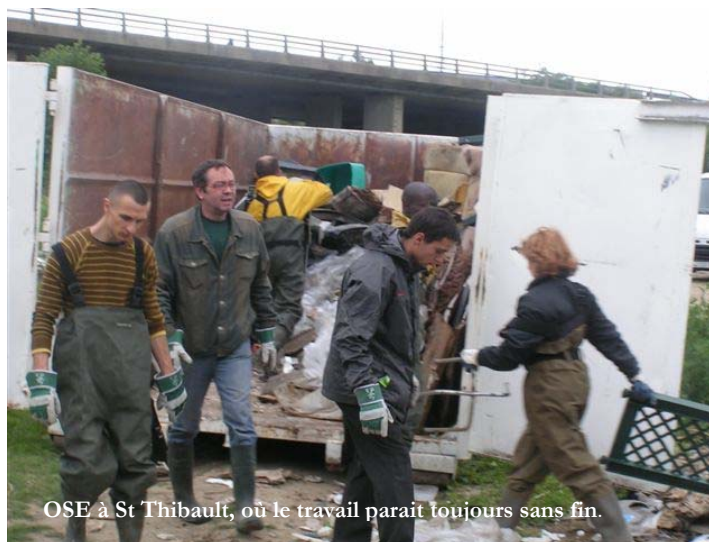
OSE à St Thibault, où le travail paraît toujours sans fin.