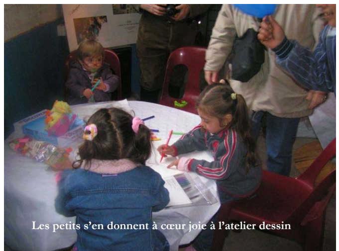
Les petits s'en donnent à cœur joie à l'atelier dessin