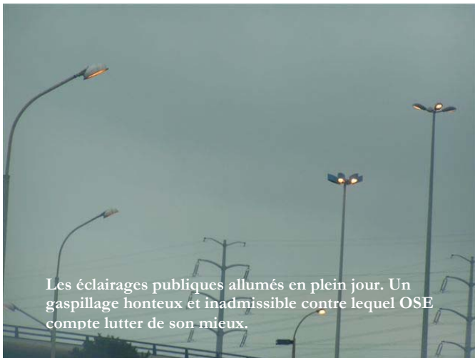
Les éclairages publics allumés en plein jour. Un gaspillage honteux et inadmissible contre lequel OSE compte lutter de son mieux.