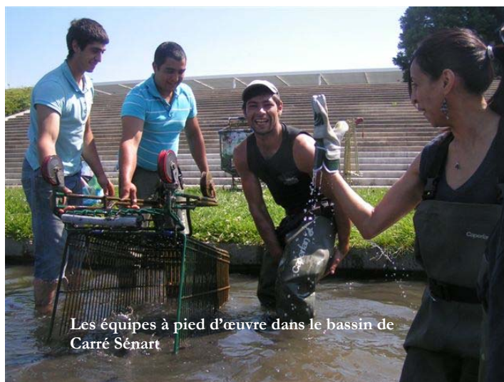
Les équipes à pied d'œuvre dans le bassin de Carré Sénart