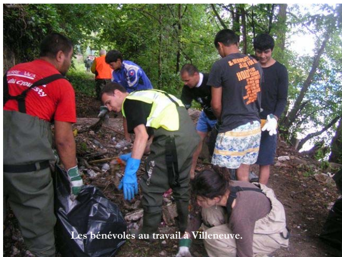
Les bénévoles au travail à Villeneuve.

L'aventure continue dans un esprit constructif comme au tout début, en 1992. Mais le secteur reste sale et méprisé par de nombreux citoyens. Peut-être pas simplement des habitants de la ville, mais certainement de la région proche. On ne peut cependant que saluer l'accueil et les efforts considérables de la Maire et de ses élus. Petite nouveauté : à la demande de ses derniers, les opérations de OSE s'orienteront vers la prévention comme en mai dernier, via la distribution de poubelles aux Roms installés le long des berges. Puis, plus directement et grâce en partie au Conseil Général et à son aide technique et financière, une ébauche de nos actions de nettoyages a pu avoir lieu sur l'Yerres, gravement touchée par la négligence de certains depuis des années déjà. Cette année, il y a eu en tout 2 grands dimanches d'action avec plus de 200 participants pour l'ensemble de la campagne de protection. De plus, lors de ces journées, des équipes se sont éparpillées sur d'autres secteurs comme Vigneux sur Seine (91), l'Yerres, Villeneuve Triage, et Ivry sur Seine. Des records absolus dans tous les sens du terme. Un grand bravo et tout nos remerciements à la Ville de Villeneuve St Georges , au Conseil Général , au SIAAP , au PAP , à la DIREN et aux VNF .