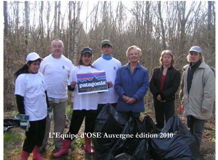
L'Equipe d'OSE Auvergne édition 2010

L'emploi du temps de la semaine était chargé : nettoyage d'une décharge sauvage à Orcines en présence des élus locaux, visite de Volvic pour mieux apprendre à protéger l'eau, ascension du Puy de Dôme par le chemin des muletiers avec ramassage des déchets abandonnés par des touristes peu scrupuleux (près de 60 kg), et une journée à Vulcania pour la détente.