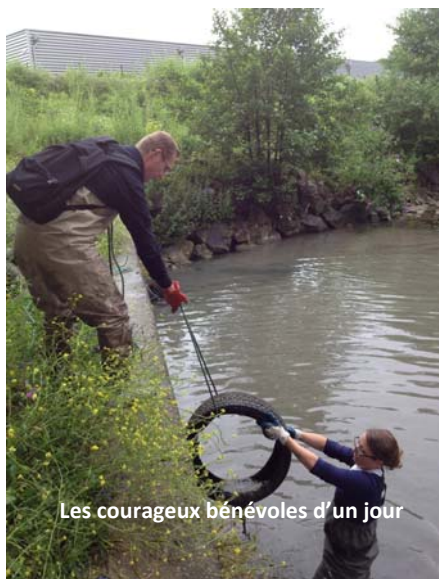
Les courageux bénévoles d'un jour

Pour la deuxième année consécutive, OSE recevait L'Oréal pour leur "Citizen Day" 2012, et le rendez-vous fut à nouveau un succès!