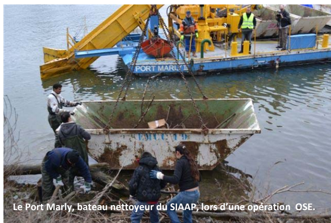
Le Port Marly, bateau nettoyeur du SIAAP, lors d'une opération OSE.

La collaboration de OSE avec le SIAAP a commencé dans les années 90, et le syndicat nous accompagnait chaque année pour plusieurs opérations où leur bateau le « Port-Marly » était mis à notre disposition, permettant grâce à ses bennes le retrait et l'acheminement de plusieurs tonnes de déchets vers les points de retraitement.