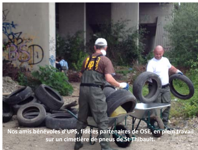
Nos amis bénévoles d'UPS, fidèles partenaires de OSE, en plein travail sur un cimetière de pneus de St Thibault.