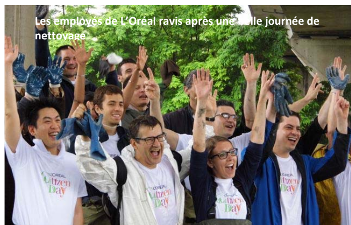
Les employés de L'Oréal ravis après une belle journée de nettoyage

Les bénévoles ont fait preuve d'une motivation hors pair malgré la pluie en début de matinée, et ont travaillé sans relâche, sur les berges comme dans l'eau pour certains, retirant pneus, gravats, bouteilles, frigos... Les résultats de cette journée dépassent l'entendement, avec près de 100m 3 retirés des berges de Seine. Un bel exemple de ce que peut faire une entreprise pour le bien de la collectivité et pour l'avenir d'un monde meilleur et le salut des générations futures!