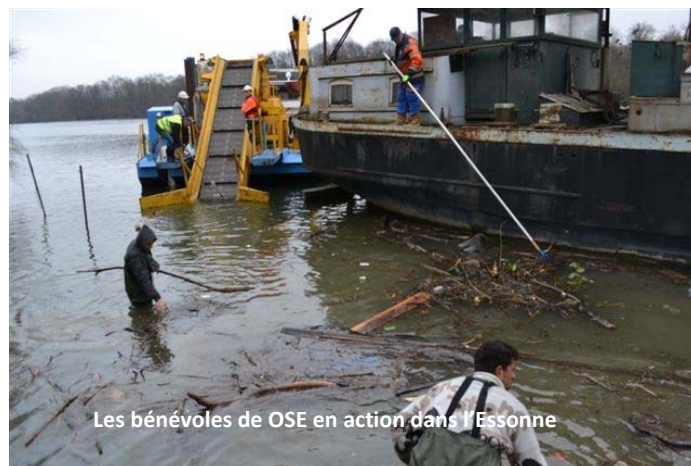
Les bénévoles de OSE en action dans l'Essonne

Commencée en 1992, la campagne de protection en Essonne était allée bon train jusqu'en 2001 puis s'était atténuée au fil des années. Et depuis deux ans, je voyais la pollution se déplacer du Val de Marne aux berges du département voisin, l'Essonne.