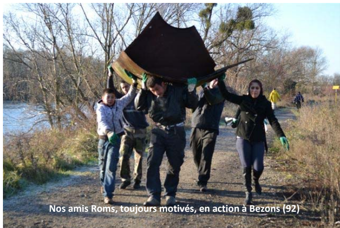
Nos amis Roms, toujours motivés, en action à Bezons (92)

Et peut-être que d'ici peu notre campagne « Seine Propre » se terminera là-bas avec un bel exemple de gestion complète et autonome du secteur par les institutions locales.