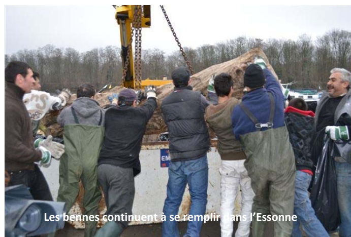
Les bennes continuent à se remplir dans l'Essonne