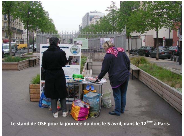
Le stand de OSE pour la journée du don, le 5 avril, dans le 12ème à Paris.

C'est cette idée que j'ai eu, il y a 3 ans : faire une opération « non consommation » pendant une journée en donnant nos produits de consommation à des amis mais aussi à des gens de la rue, de nos quartiers ou ailleurs.