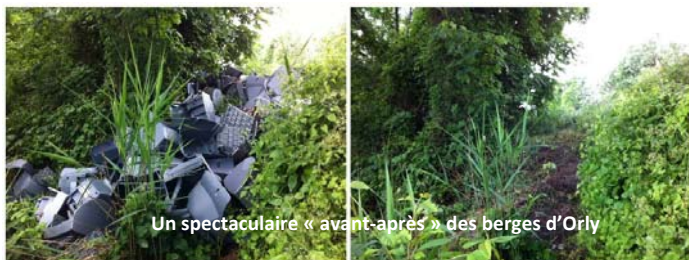
Un spectaculaire « avant-après » des berges d'Orly

Grâce aux efforts des JSPP, l'intégralité de ces téléviseurs a pu être ramassée et ramenée à Villeneuve St Georges où ils ont été pris en charge, comme le reste des déchets ramassés, par un camion du Conseil Général.