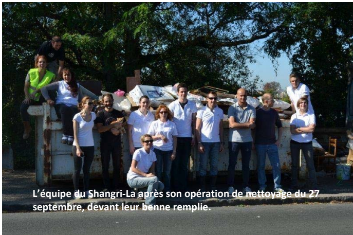
L'équipe du Shangri-La après son opération de nettoyage du 27 septembre, devant leur benne remplie.

Tout d'abord, le 27 septembre, ce sont les employés de l'Hotel Shangri-La qui ont participé, via la fondation GoodPlanet , à une opération de ramassage, une première pour eux.