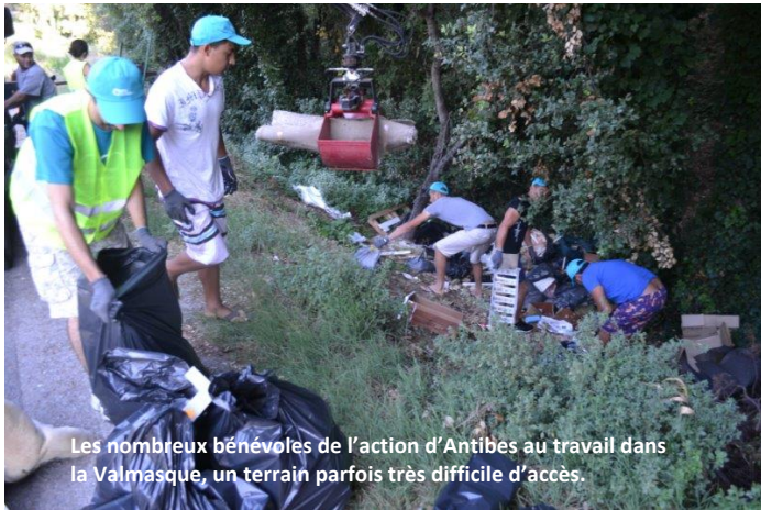
Les nombreux bénévoles de l'action d'Antibes au travail dans la Valmasque, un terrain parfois très difficile d'accès.

nombreux Roms d'Antibes, ainsi qu'un volontaire d'une entreprise privée... et bien sûr toute l'équipe de OSE ainsi que mes propres enfants! Bref, un véritable bonheur, salué par le journal Nice Matin. Comme tous les ans, nous sommes intervenus dans la forêt de la Valmasque aux Trois Moulins (un ancien site de sorcières au Moyen Age !) et maintenant laissé à l'abandon. Des tonnes de déchets ont été ramassées par les nombreux bénévoles, et ensuite retirés par la CASA. L'ambiance était bonne, et malgré les moustiques et la chaleur, l'action fut un vrai succès.