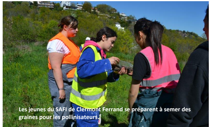
Les jeunes du SAFI de Clermont Ferrand se préparent à semer des graines pour les pollinisateurs.

Le programme de protection et de soutien de nos amies les abeilles s'est poursuivi cette année avec des milliers de graines semées à la jetée en Auvergne par les jeunes du SAFI et l'aide à l'entretien du champ de fleurs de la Ligue de Protection des Abeilles du Var! La distribution de graines de fleurs à la volée se poursuivra en 2015 et peut-être même en Ile de France.