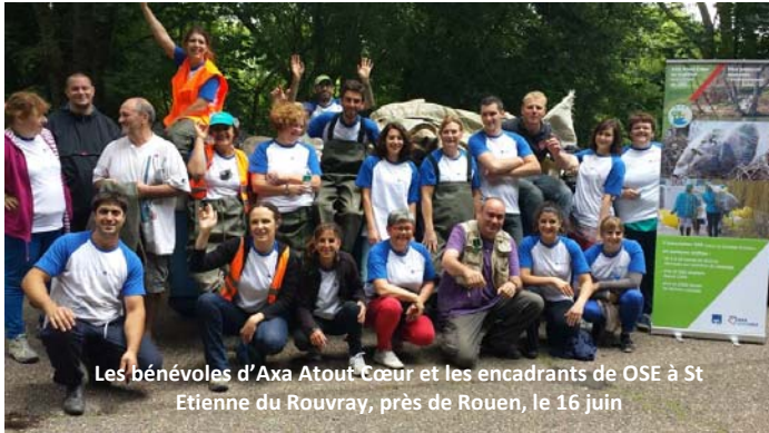
Les bénévoles d'Axa Atout Cœur et les encadrants de OSE à St Etienne du Rouvray, près de Rouen, le 16 juin

AXA Atout Cœur aide les causes sociétales et humanitaires dans les domaines, notamment, de l'aide aux personnes handicapées, de la santé, de l'environnement et de la lutte contre toutes les formes d'exclusion. Ainsi, depuis plus de vingt ans, cette association permet aux collaborateurs d'AXA de participer ponctuellement ou dans la durée à des actions qui illustrent le goût du partage avec les plus démunis, ou qui sont au service des causes sociétales.