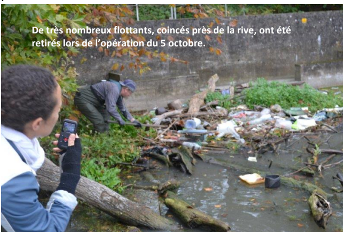
De très nombreux flottants, coincés près de la rive, ont été retirés lors de l'opération du 5 octobre.

La totalité des berges a été nettoyée, avec un record de participants et de moyens matériels.... du jamais vu.