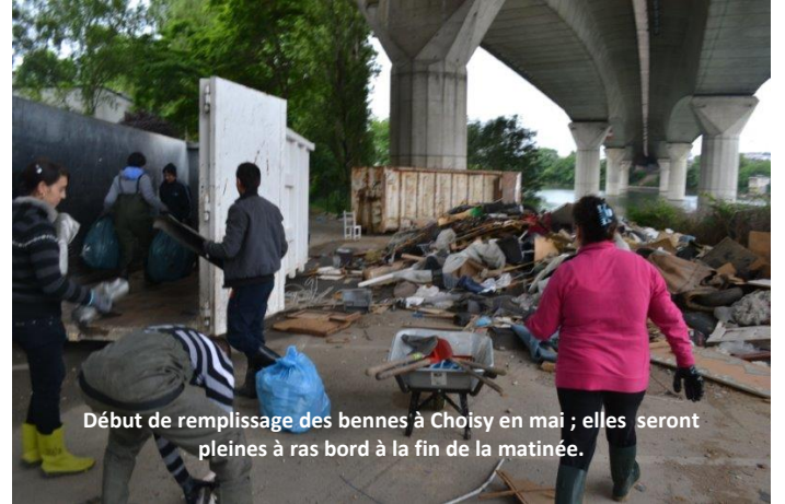
Début de remplissage des bennes à Choisy en mai ; elles seront pleines à ras bord à la fin de la matinée.

Près de 100 m 3 de déchets ont été ramassés lors de ces deux opérations, sur 150 mètres de berges. Un travail colossal, et un nombre incalculable d'objets ramassés, de piles recyclées, etc.