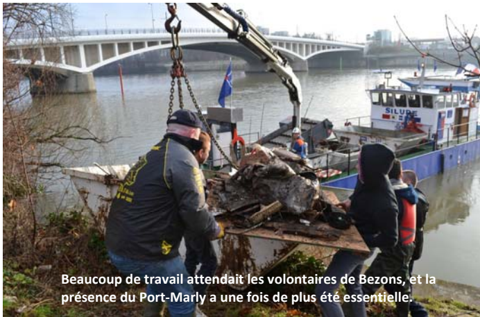
Beaucoup de travail attendait les volontaires de Bezons, et la présence du Port-Marly a une fois de plus été essentielle.

Que dire de plus que l'an dernier ? Les rives de Bezons restent très touchées. Peut-être un peu moins qu'en 2013. Quoi qu'il en soit, en janvier dernier, et heureusement avec un hiver très doux, nous avons commencé la saison dans le Val d'Oise avec ferveur et tous nos amis, petits et grands, venus de toute l'Ile de France.