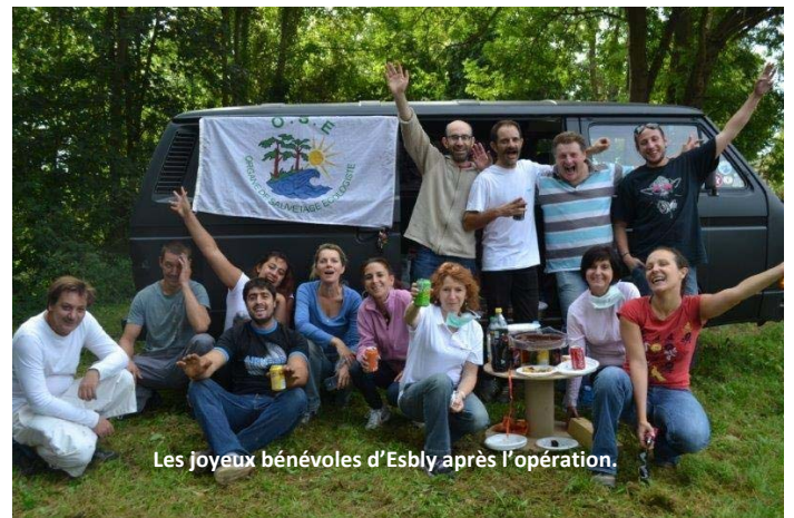
Les joyeux bénévoles d'Esbly après l'opération.