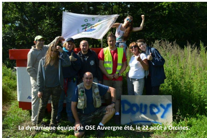
La dynamique équipe de OSE Auvergne été, le 22 août à Orcines.

En général, lorsqu'on nettoie un site en Auvergne, le travail est fait pour des années car il est très rare d'y voir les lieux être re-pollués. Nous avons donc beaucoup d'espoir pour cette région.