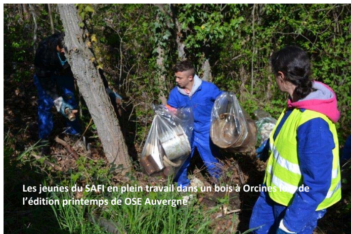
Les jeunes du SAFI en plein travail dans un bois à Orcines lors de l'édition printemps de OSE Auvergne

En avril ont eu lieu de belles rencontres avec les jeunes du SAFI, qui ont redoublé d'efforts cette année pour des opérations s'étendant de Durtol à Orcines.