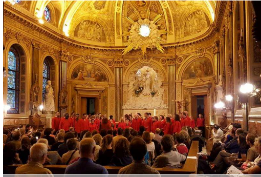
Pour en savoir plus sur la troupe Arlequin: www.arlequingospel.com

OSE aura plaisir à renouveler l'expérience dès que possible et remercie vivement Arlequin's Gospel, la Congrégation des Spiritains et le public pour ce bel évènement.