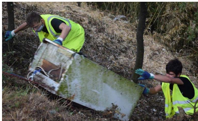
Encore une fois, OSE a brillé aux côtés des équipes communales et de leur excellent Maire lors de la grande opération estivale sur ROQUEFORT les Pins; ainsi des tonnes de déchets ont été retirées par les équipes de la CASA ramassant comme depuis des années les tas de déchets réalisés par la super équipe de bénévoles de cette année.