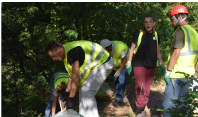
Fin juillet OSE a de nouveau ouvert un nouveau front sur un site assez touché à savoir sur les bords du Loup dans les Alpes Maritimes, plus précisément sur la Tourette sur Loup !! des centaines de Kg de déchets ont été extraits non sans mal des pentes du torrent ! un courrier sera envoyé à mairie en cette fin d'année pour obtenir de l'aide pour 2021 ! en attendant la CASA a pris le relais derrière nous en collectant notre pêche miraculeuse !