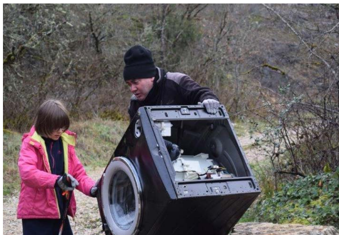
Opération de nettoyage en Dordogne fin décembre 2019 en famille près de Montignac.