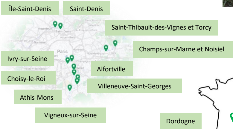
Carte des opérations OSE 2023